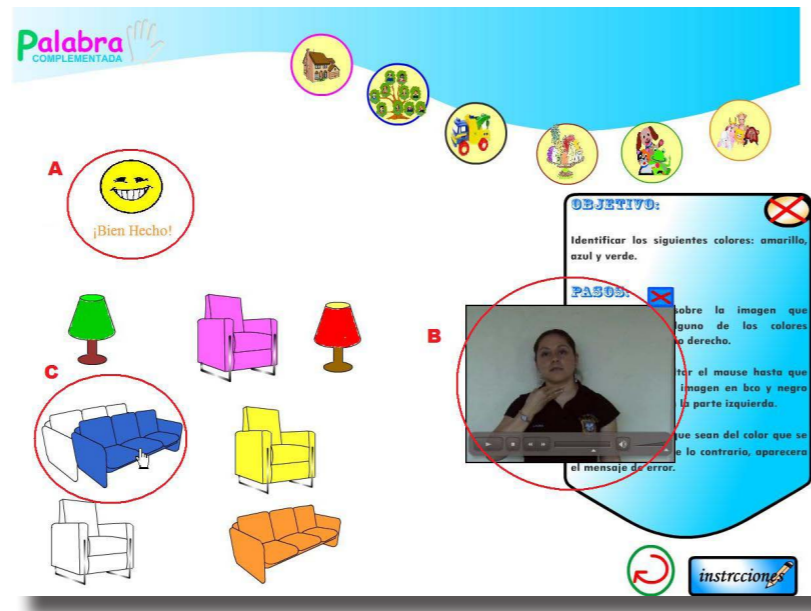
Figura 3. Pantalla que muestra la actividad de asociar. En A) se observa el indicador de éxito o falla de la actividad, en este ejemplo se indica que la relación fue errónea. En B) Una persona aparece empleando palabra complementada para indicar la actividad realizada, así como el vocabulario de la actividad. En C) se observa como el niño trata de cumplir la actividad asociativa colocando el sillón azul en el marco vacío de otro sillón.