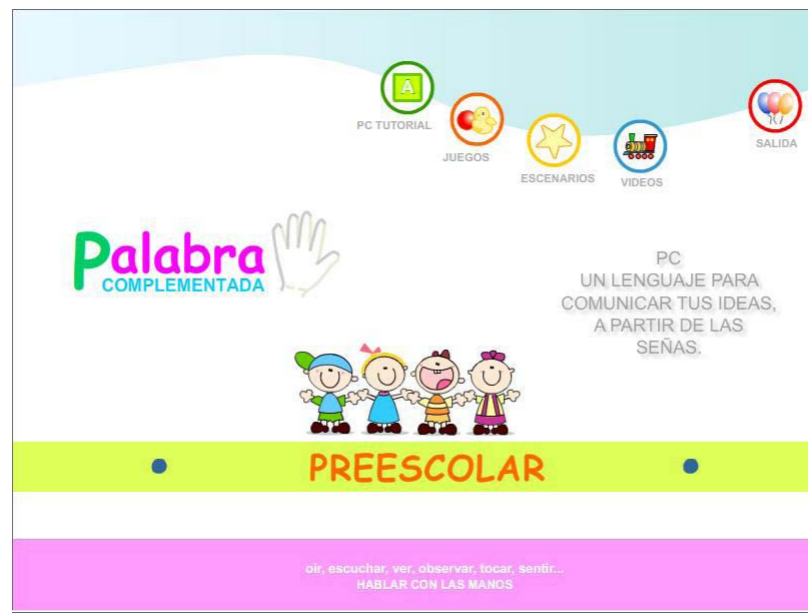
Figura 2. Interfase de usuario principal del prototipo. A través de esta ventana el estudiante puede acceder a las diferentes actividades de aprendizaje de la palabra complementada. Todas las funciones se despliegan como íconos que el estudiante puede asociar fácilmente con la actividad que desarrolla en el salón de clases regularmente.

requiere para ello arrastrar y soltar objetos en las posiciones indicadas para completar la actividad. La mayoría de las actividades como relación de conceptos, rompecabezas y memorama requieren de esta capacidad para que el usuario interactúe y manipule los objetos, ver por ejemplo la figura 3 (C).