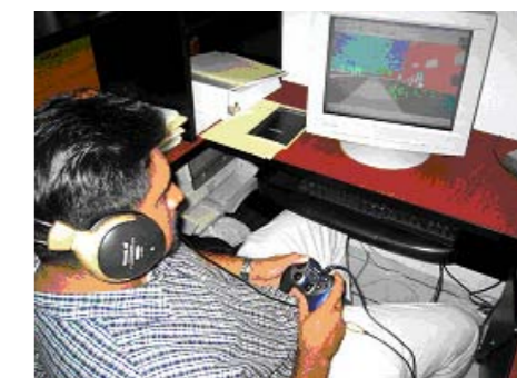
Figura 3 - Experto en ingeniería de software interactuando con el ambiente virtual.

La calificación total asignada al ambiente virtual fue la suma de las calificaciones entre tres, por lo tanto la calificación que el Grupo 3 otorga a la usabilidad del ambiente virtual por la evaluación de las heurísticas es 72.