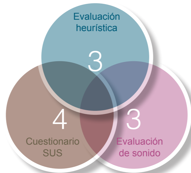
Figura 2 - Combinación de pruebas

el cuestionario SUS no se evalúa el sonido y una evaluación socio-demográfica que consiste en recopilar los datos personales del experto, edad, género, preguntas acerca de la condición física de sus sentidos (ya que los ambientes virtuales son multisensoriales), su experiencia en el manejo de videojuegos, ya que el dispositivo que se utiliza en Realtown es un gamepad, que es un dispositivo de entrada y de navegación que se utiliza para interactuar con videojuegos, y también se pregunta su experiencia en el uso de ambientes virtuales y algunos ejemplos de dispositivos que han utilizado para estos sistemas.