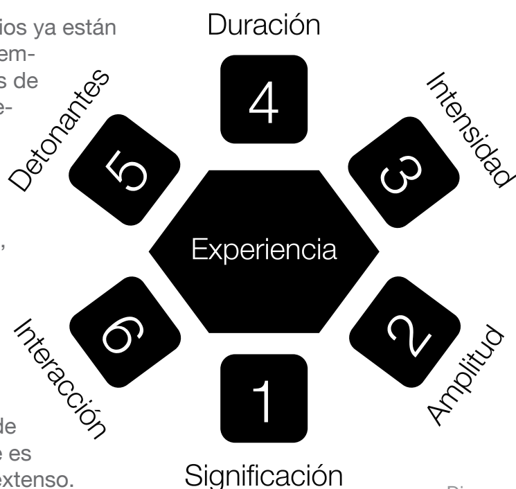
Diagrama: Dimensiones de la Experiencia 1

En esencia, siempre estamos comprando. Desde el primer momento que proyectamos la necesidad de algo (o de algo mejor), comenzamos a comprar, incluso si no lo hemos reconocido ni hemos comenzado a investigar alternativas a propósito. Nuestras experiencias utilizando un producto o servicio aun son parte del proceso compra-